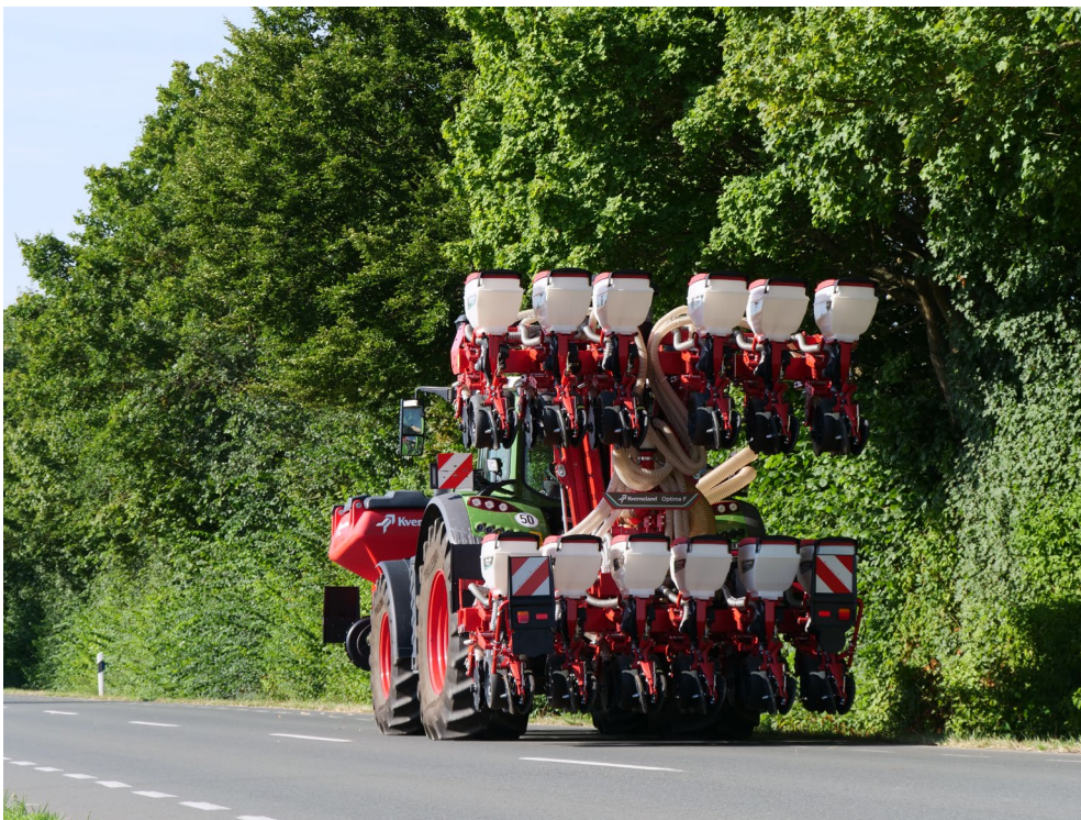
Optima F with 12 SX IN posizione di trasporto

Optima F è dotata di un telaio da 6m a ripiegamento idraulico, disponibile a 8 o 12 file in versione e-drive II o SX. Utilizzabile sia su terreni preparati in modo convenzionale con minime lavorazioni o addirittura su terreni sodi. L'accoppiamento con i nuovi serbatoi f-drill la rende utilizzabile anche con trattori di medie potenze.